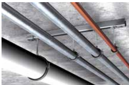
Tubazioni leggere sospese