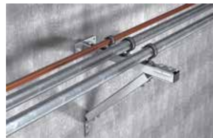
Installazione leggera su mensola