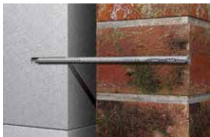
Risanamento murature faccia vista