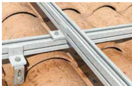
Incrocio tra profili Solar-fish