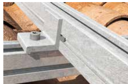
Dettaglio: Staffa di collegamento XC