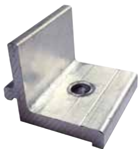
Staffa di collegamento XC AL