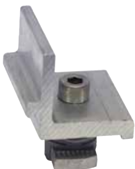
Staffa di collegamento preassemblata PXC