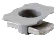
Dado testa a martello FCN AL