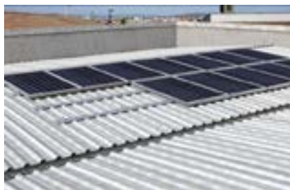
Copertura industriale in lamiera grecata