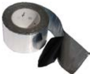
Nastro adesivo butilico CG INT