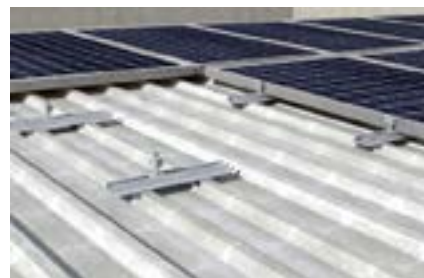
Installazione su copertura industriale con P 400