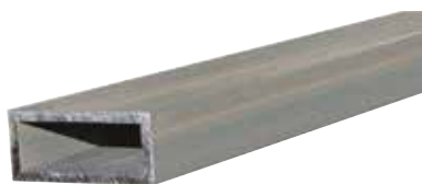
Profilo REP AL