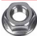
Dado flangiato MU F A2