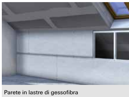
Parete in lastre di gessofibra