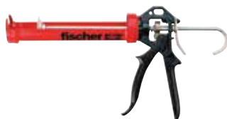
Pistola manuale KPM 2 PLUS