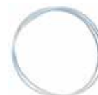
Prolunga per miscelatore FIS EXT Ø 15