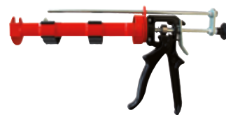
Pistola manuale FIS AM-I