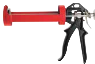
Pistola manuale FIS AC