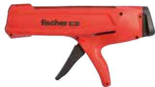
Pistola manuale FIS DM S