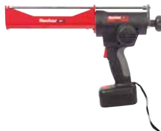
Pistola a batteria FIS DC S