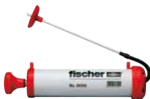
Pompetta manuale ABG