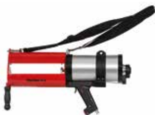
Pistola pneumatica FIS DP-XL