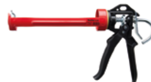
Pistola manuale KPM 310