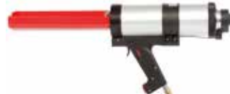
Pistola pneumatica FIS DP S-L