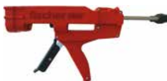
Pistola manuale FIS DM C