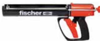
Pistola manuale FIS DM S-L

1) Prodotto disponibile fino ad esaurimento scorte