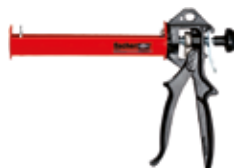
Pistola manuale KPM 2