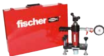
Estrattore da 25 kN