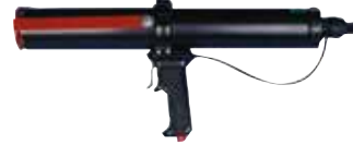
Pistola pneumatica FIS DP C