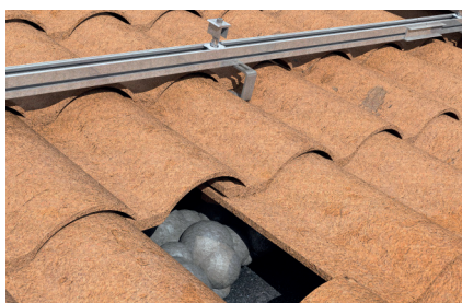
Fissaggio di tegole e coppi