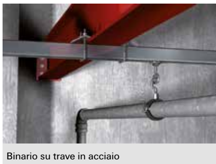
Binario su trave in acciaio