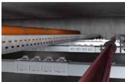
Connettore per sistemi a griglia