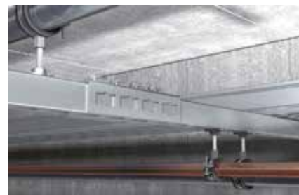
Connessione longitudinale binari di montaggio