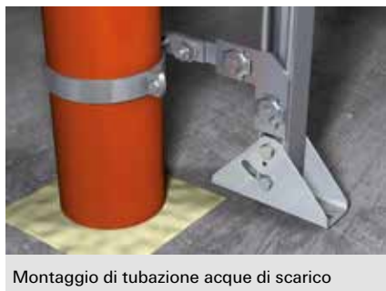
Montaggio di tubazione acque di scarico